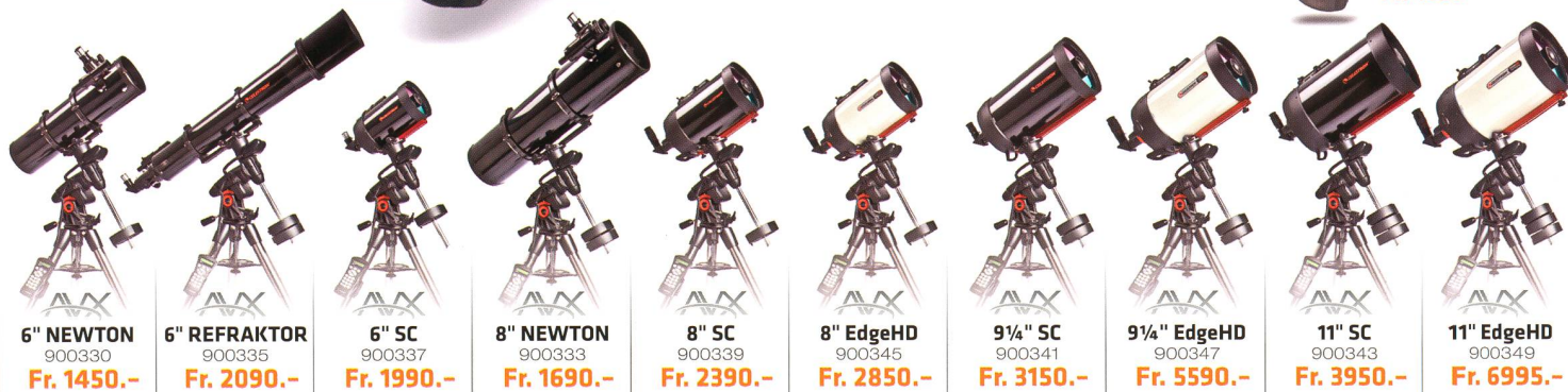
6" NEWTON 900330 Fr. 1450.-