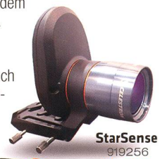
StarSense 919256 Fr. 519.-

Die AVX verfügt neben einem RS232-Anschluss auch über einen Autoguider-Eingang und zwei AUX-Anschlüsse. Hier können Sie zusätzliche, separat erhältliche Erweiterungsmodule anschliessen – zum Beispiel das SkyQ Link Modul für die Steuerung über WLAN mit iPhone/iPad/Windows-PC oder das StarSense-Modul , mit dem die Montierung ihre Referenzsterne automatisch anfährt und perfekt zentriert.