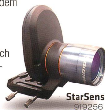
StarSense 919256 Fr. 519.-

Die AVX verfügt neben einem RS232-Anschluss auch über einen Autoguider-Eingang und zwei AUX-Anschlüsse. Hier können Sie zusätzliche, separat erhältliche Erweiterungsmodule anschliessen – zum Beispiel das SkyQ Link Modul für die Steuerung über WLAN mit iPhone/iPad/Windows-PC oder das StarSense-Modul , mit dem die Montierung ihre Referenzsterne automatisch anfährt und perfekt zentriert.