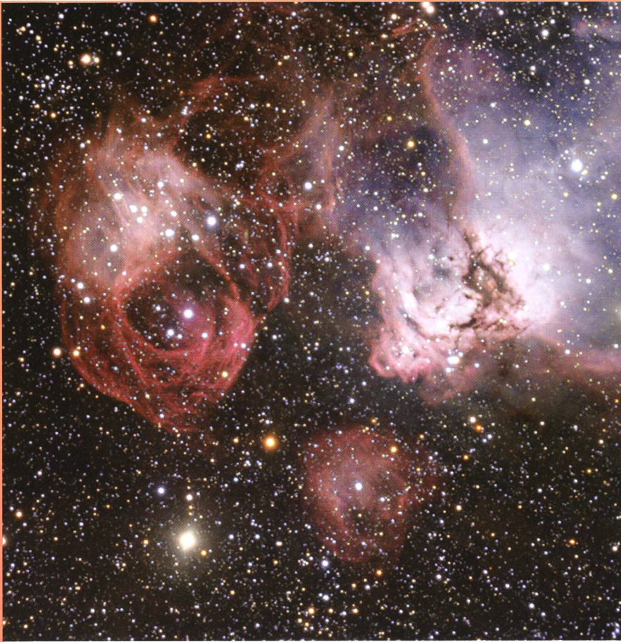
Bild: Ein neues Bild des Very Large Telescope der ESO zeigt eines der unbekannteren Gebiete der Grossen Magellanschen Wolke im Detail: Eine Gas- und Staubwolke, in der heisse neue Sterne geboren werden, die ihre Umgebung zu eigenartigen Gebilden verformen. Allerdings zeigt dieses Bild auch den Effekt von Sterntod – Filamente, die in Folge von Supernovaexplosionen entstanden sind (links).