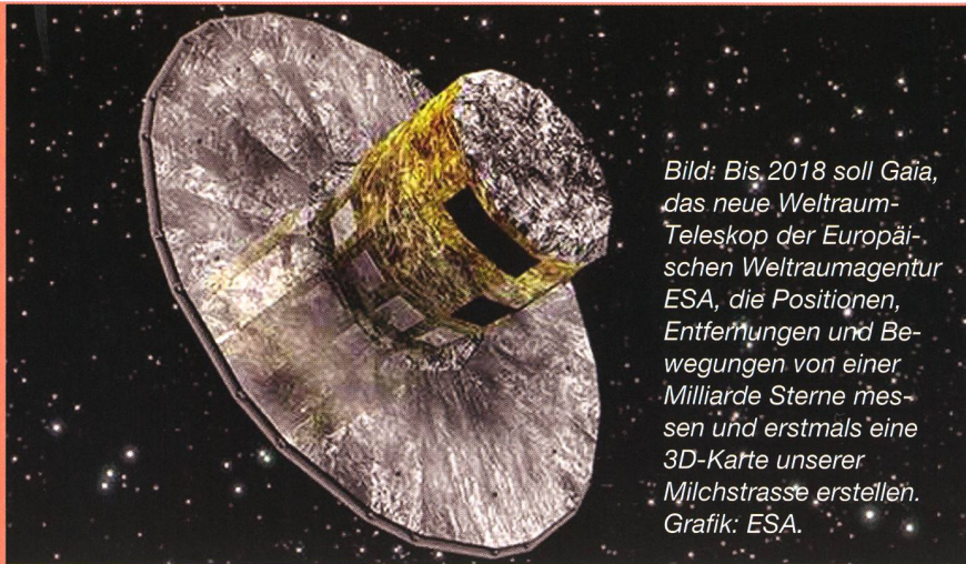
Bild: Bis 2018 soll Gaia, das neue Weltraum-Teleskop der Europäischen Weltraumagentur ESA, die Positionen, Entfernungen und Bewegungen von einer Milliarde Sterne messen und erstmals eine 3D-Karte unserer Milchstrasse erstellen. Grafik: ESA.