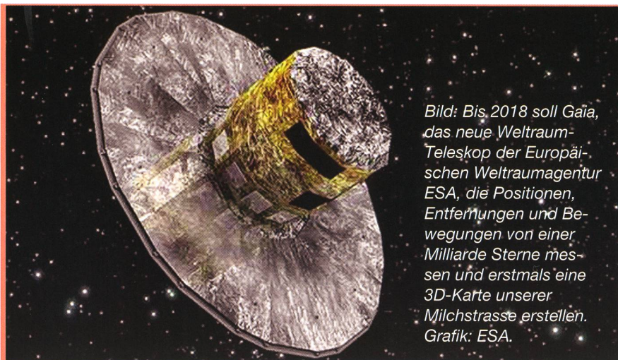
Bild: Bis 2018 soll Gaia, das neue Weltraum-Teleskop der Europäischen Weltraumagentur ESA, die Positionen, Entfernungen und Bewegungen von einer Milliarde Sterne messen und erstmals eine 3D-Karte unserer Milchstrasse erstellen. Grafik: ESA.