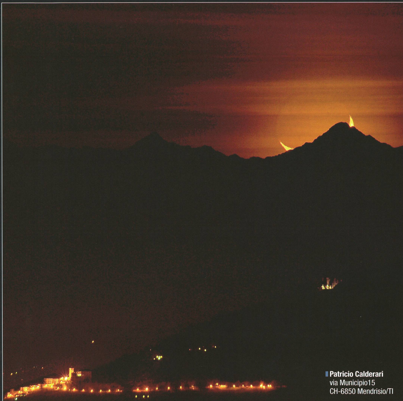
■ Patricio Calderari via Municipio15 CH-6850 Mendrisio/TI