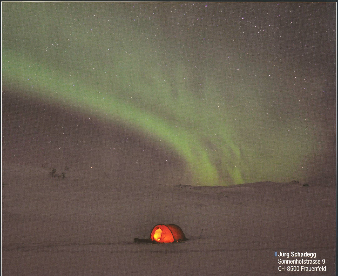
■ Jürg Schadegg Sonnenhofstrasse 9 CH-8500 Frauenfeld

Entstanden ist das obige Bild recht genau auf der norwegisch-schwedischen Grenze in der weiteren Umgebung von Narvik. Fast jedes Jahr ziehe ich, manchmal alleine, manchmal aber auch mit anderen Personen, durch die skandinavische winterliche Wildnis. Im Schlepptau ein ca. 50 kg schwerer Pulka, d.h. ein Hundeschlitten für Menschen. Ich bin also der Hund! Mit Schneeschuhen ziehe ich so durch die tief verschneite Gegend. Da alles vereist ist, muss ich, um Wasser zu gewinnen, Schnee schmelzen. Zum Überleben ist es also entscheidend, einen zuverlässigen und mit genug Brennstoff versehenen Kocher dabei zu haben. Das Zelt und der Schlafsack müssen den