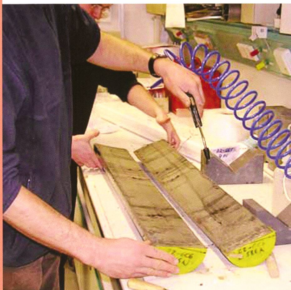
Bild: Ein aufgetrenntes Bohrkernsegment einer Sedi- mentprobe aus dem Schwarzen Meer.

Während der letzten Eiszeit vor 41'000 Jahren kam es zu einer vollständigen und schnellen Umpolung des Erdmagnetfeldes. Dies belegen magnetische Untersuchungen des Deutschen GeoForschungs-Zentrums GFZ an Sedimentbohrkernen aus dem Schwarzen Meer. Zudem wies das Wissenschaftlerteam um GFZ-Forscher NORBERT NOWACZYK und HELGE ARZ mit weiteren Daten anderer Studien aus dem Nordatlantik, dem Südostpazifik sowie Hawaii nach, dass diese Umpolung ein globales Ereignis war. Erstaunlich ist die