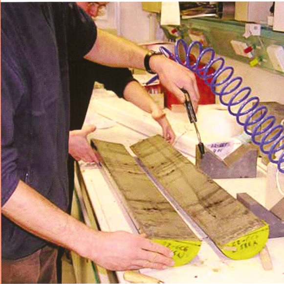
Bild: Ein aufgetrenntes Bohrkernsegment einer Sedimentprobe aus dem Schwarzen Meer.

Während der letzten Eiszeit vor 41'000 Jahren kam es zu einer vollständigen und schnellen Umpolung des Erdmagnetfeldes. Dies belegen magnetische Untersuchungen des Deutschen GeoForschungs-Zentrums GFZ an Sedimentbohrkernen aus dem Schwarzen Meer. Zudem wies das Wissenschaftlerteam um GFZ-Forscher NORBERT NOWACZYK und HELGE ARZ mit weiteren Daten anderer Studien aus dem Nordatlantik, dem Südostpazifik sowie Hawaii nach, dass diese Umpolung ein globales Ereignis war. Erstaunlich ist die