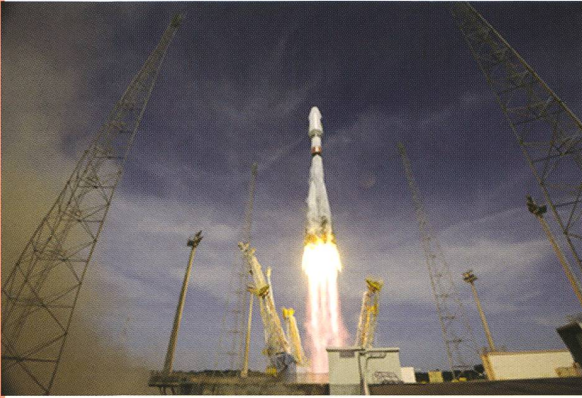
Bild: Am 12. Oktober 2012 startete eine Sojus-Rakete mit zwei Galileo-Satelliten ins All.

Der von Ariespace betriebene Sojus-ST-B-Träger hob wie geplant am 12. Oktober 2012 ab. Alle Stufen der Sojus funktionierten planmässig und die Fregat-MT-Oberstufe setzte die Galileo-Satelliten 3 Stunden und 45 Minuten nach dem Start in etwa 23'200 km Höhe aus. Nach ersten Tests werden die Satelliten zur Einsatzprobung der Galileo-Dienste an die Galileo-Kontrollzentren in Oberpfaffenhofen, Deutschland, und Fucino, Italien, übergeben.