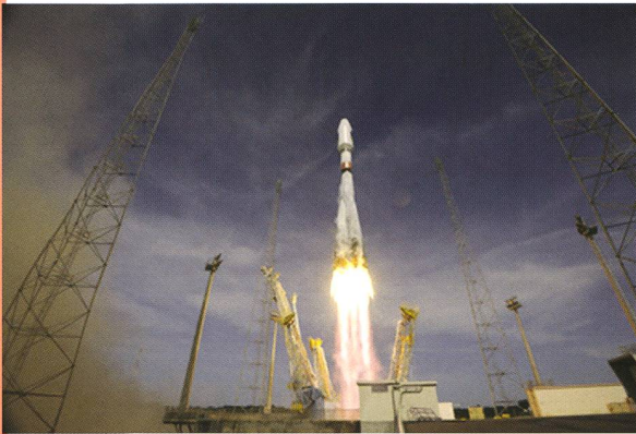
Bild: Am 12. Oktober 2012 startete eine Sojus-Rakete mit zwei Galileo-Satelliten ins All.

Der dritte und der vierte Satellit des globalen europäischen Navigationssatellitensystems Galileo wurden am 12. Oktober von Europas Raumflughafen in Französisch-Guayana aus in den Weltraum gebracht. Sie gesellen sich zu dem vor einem Jahr gestarteten ersten Satellitenpaar, um die Validierungsphase des Galileo-Programms abzuschliessen.