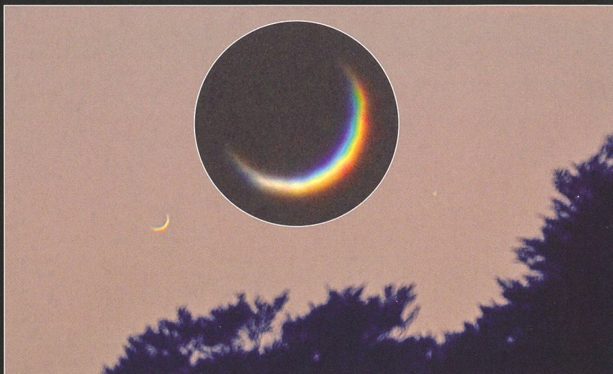
Abbildung 2: Dies ist nicht die Mondsichel, sondern Venus am 1. Juni 2012, nur wenige Tage vor dem Transit, aufgenommen mit einem Meade (2760 mm Brennweite). Der Punkt rechts ist Merkur. Die Ausschnittvergrößerung von MARKUS BURCH zeigt die schon fast leere Venus.

Kaum hat Venus die Sonne überquert, konnte sie schon wenige Tage später am Morgenhimmel erspäht werden. Dass sie sich momentan rückläufig vom Tagesgestirn entfernt, erklärt den rasch grösser werdenden Winkelabstand. Bereits am 12. Juli 2012 strahlte der «Morgenstern» im grössten Glanz und erreicht am 15. August 2012 mit 45° 48' die maximale westliche Elongation. Durch ein Fernrohr betrachtet, schrumpft das Venusscheibchen von scheinbaren 28" Durchmesser Anfang August auf 15.9" Ende September 2012, derweil die Beleuchtung weiter zunimmt. Am 1. August 2012 erscheint unser innere Nachbarplanet knapp zur Hälfte beschie-