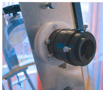
Figure 1: Le porte oculaire hélicoïdale.

fier l'ensemble de la structure. Ensuite chacun lors de la construction va proposer ses propres adaptations aux plans de base. Pour ma part, j'ai surtout rajouter une plateforme qui permettra de mettre un chercheur Telrad, j'ai fait construire un support en alu pour le porte-oculaire, ainsi qu'un système de vis poussantes sur les quatre côtés de la base de la cage du primaire afin de permettre un centrage parfait du miroir.