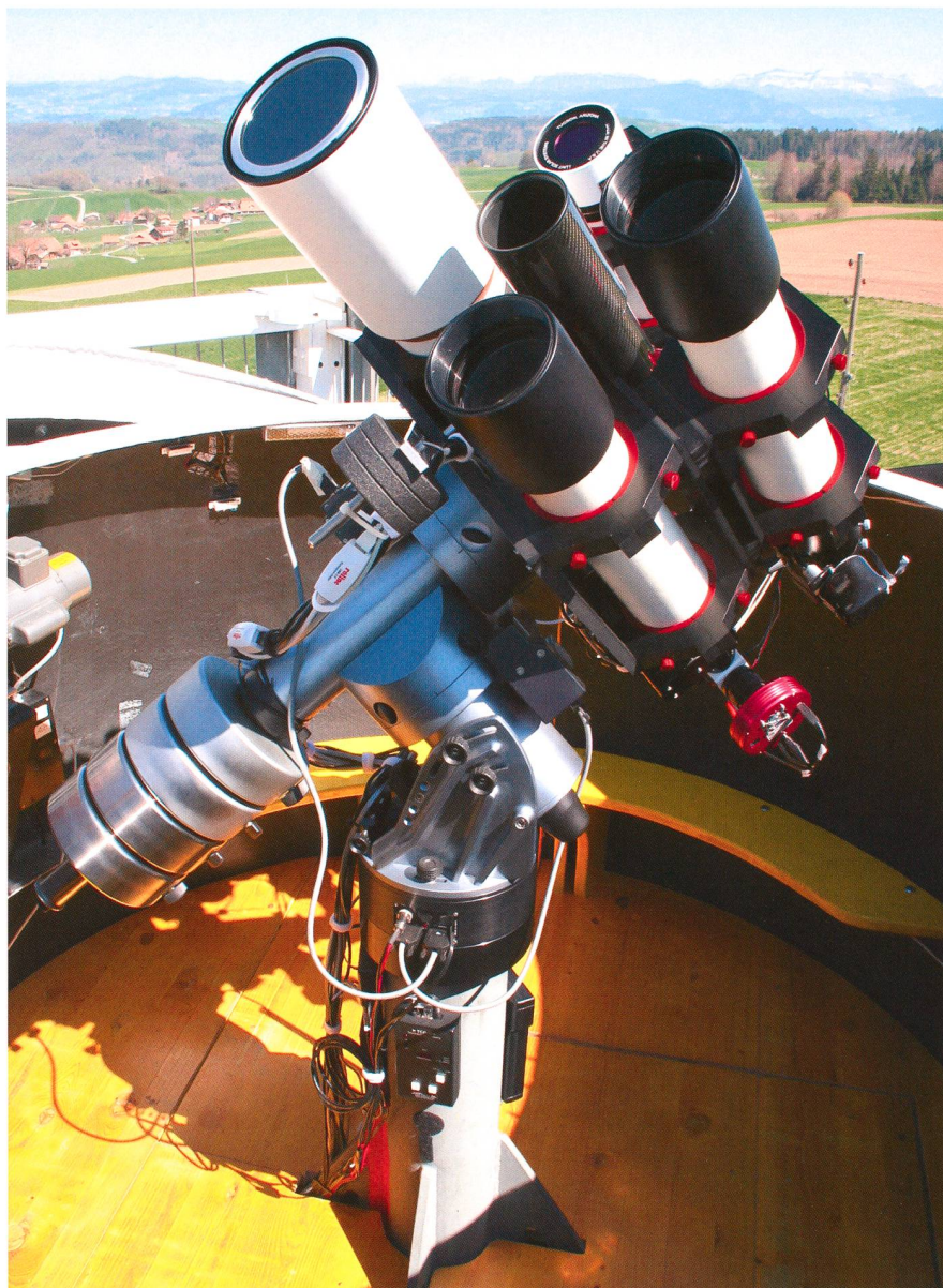
Abbildung 4: Die QCI-Steuerungselektronik der Montierung ist in einer Box zwischen dem Montierungsflansch und dem Säulenflansch untergebracht. Die beiden scheinbar lose hängenden grauen Kabel sind die Steuerungskabel für den Rektaszensions- und den Deklinationsmotor.