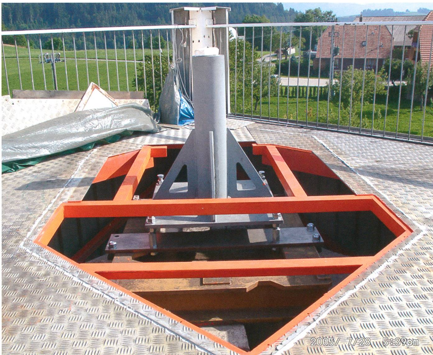
Abbildung 3: Die selbstkonstruierte Stahlsäule mit integriertem Nivelliersystem auf dem massiven, vom Rest des Gebäudes unabhängigen Instrumentensockel des Turms vor dem Aufsetzen der Clamshell Kuppel.

Leider existiert kein ASCOM Treiber für die Montierung. Vielmehr kann die GM2000 via dem LX200 Protokoll oder dem Astro Physics Protokoll betrieben werden. Beide Protokolle reduzieren die verfügbare Funktionalität jedoch auf diejenige einer x-beliebigen deutschen Goto Montierung. Die montierungsspezifischen Alignmentmethoden