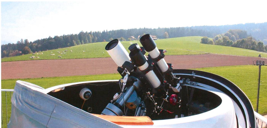
Abbildung 1: Auf der Dachterrasse des 12.5 m hohen Sonnenturms Uecht im bernischen Niedermuhlern steht unter einer 2.1 m Clamshell Kuppel von Astro Heaven auf einer GM2000 Montierung das Robotic Solar Observation Telescope (roboSOT) mit drei fernsteuerbaren Instrumenten zur Überwachung der Sonnenaktivität im weissen Licht, in Ca II K sowie in H-alpha.

Die Montierungen des italienischen Herstellers 10Micron geniessen unter Astrofotografen einen guten Ruf, insbesondere in Sachen Verarbeitungsqualität, Tragfähigkeit sowie Nachführgenauigkeit. Weniger ist jedoch bekannt, wie es um den unbeaufsichtigten automatischen Betrieb dieser mechanischen Wunderwerke steht. Auf dem Sonnenturm Uecht in Niedermuhlern setzen wir seit Herbst 2010 eine GM2000 zur Überwachung der Sonnenaktivität im Weisslicht, in Ca II K sowie in H-alpha ein – inzwischen nun auch robotisch.