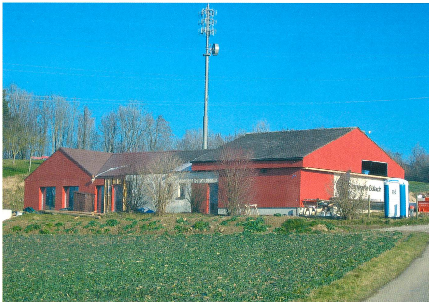
Abbildung 1: Die Schul- und Volkssternwarte Bülach wird bis zur Wiedereröffnung am 20. April 2012 rechtzeitig fertig.

Über ein Jahr war die Schul- und Volkssternwarte Bülach wegen des Erweiterungsbaus und diversen Renovationsarbeiten für das Publikum geschlossen. Jetzt erstrahlt das Gebäude aus dem Jahre 1983 in «neuem Glanz», genau rechtzeitig zum nächstjährigen 30-Jahr-Jubiläum. Am Wochenende vom 20. bis 22. April 2012 wird das Observatorium auf dem Dättenberg oberhalb Eschenmosen mit einem grossen Fest feierlich eingeweiht.