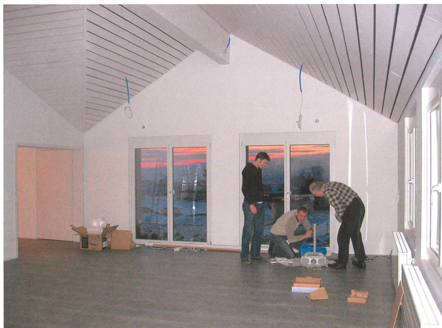
Abbildung 3: Der Endspurt ist auch im Inneren der Sternwarte in vollem Gange. Das Techniker-Team baut die Beameraufhängung zusammen.

Die nicht-astronomischen Räumlichkeiten der Sternwarte werden künftig für externe Seminare, Kurse und Klausurtagungen während des Tages nach Vereinbarung vermietet.