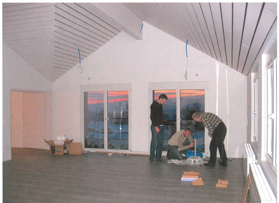
Abbildung 3: Der Endsprint ist auch im Inneren der Sternwarte in vollem Gange. Das Techniker-Team baut die Beameraufhängung zusammen.

Die nicht-astronomischen Räumlichkeiten der Sternwarte werden künftig für externe Seminare, Kurse und Klausurtagungen während des Tages nach Vereinbarung vermietet.