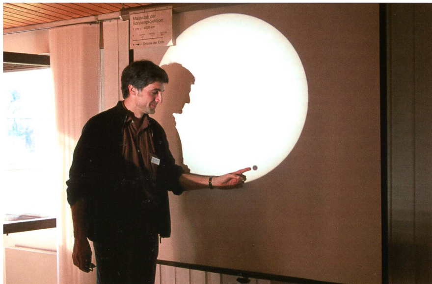
Am Heliostaten der Sternwarte Bülach liess sich der Venustransit 2004 hervorragend beobachten.

Venus erreicht mit -4.5^{\text{mag}} ihren «Grössten Glanz» am Morgenhimmel.