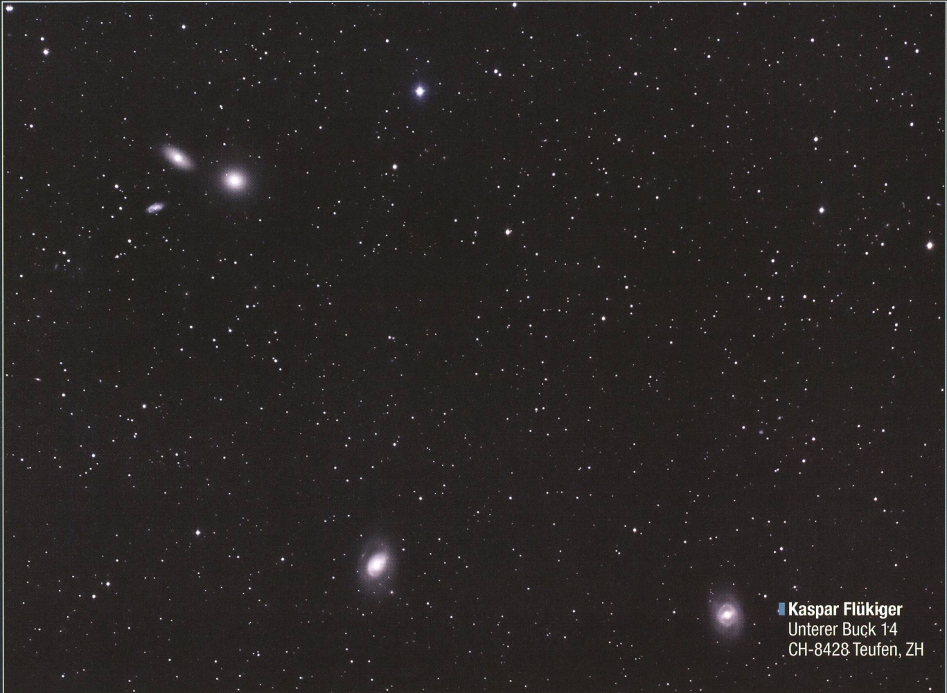
■ Kaspar Flükiger Unterer Buck 14 CH-8428 Teufen, ZH