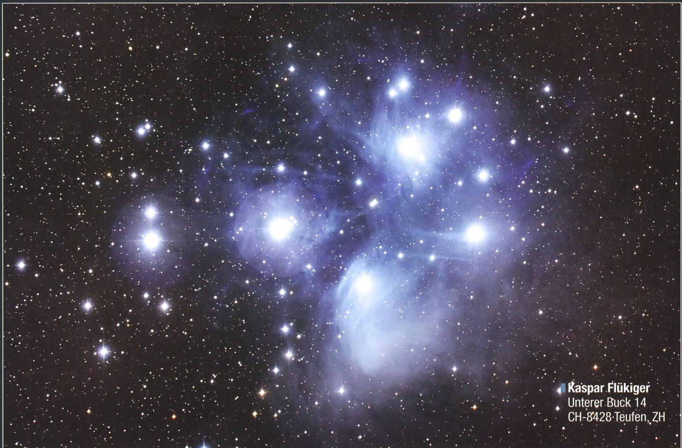
■ Kaspar Flükiger Unterer Buck 14 CH-8428 Teufen, ZH