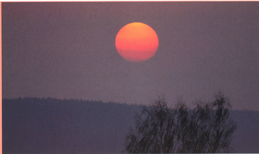
Am Samstag, 17. April 2010 färbte sich die Sonne blutrot.