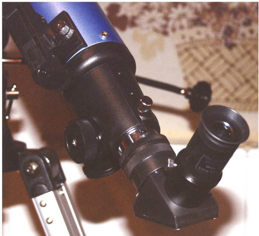
Detailansicht des Okularauszugs des Skywatcher 70/900 mm-Refraktors.

Diese Frage mag aufgrund der beschriebenen Stärken und Schwächen berechtigt erscheinen. Ein Einsteiger wird sich mit den Nachteilen sehr schwer tun und die Fehlerquellen, die von Teleskop zu Teleskop individuell verschieden stark ausfallen, kaum identifizieren können. Als Einsteiger-Teleskop sind solche billigen Geräte also von wenigen Ausnahmen abgesehen denkbar ungeeignet. Dennoch bieten sie einige nicht zu verschweigende Vorteile gegenüber grossen Teleskopen: Sie sind verglichen mit diesen schnell aufgebaut und betriebsbe-