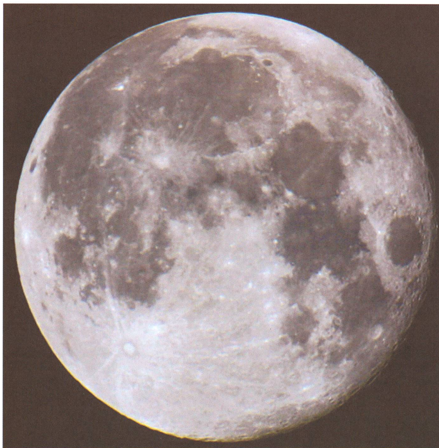
Der Mond mit 80mm Öffnung und 650mm Brennweite.

Jedoch hat hier die Physik Grenzen gesetzt. Die maximal sinnvolle Vergrößerung ist grundsätzlich der doppelte Objektivdurchmesser in Millimeter. Darüber hinaus machen sich physikalisch bedingte Beugungsunschärfen bemerkbar, und das Bild wird merklich dunkler. Mit einem 70 mm-Teleskop kann man beispielsweise maximal 140-fach vergrößern. Das klingt subjektiv wenig, aber für viele Mond- und Planetenbeobachtungen ist das völlig ausreichend. Im Bereich von Sternhaufen und Nebeln ist sogar eine möglichst geringe Vergrößerung wünschenswert. Dies wird von der Werbung leider oft verschwiegen. Die förderliche Vergrößerung, ab der keine weiteren Details aufgelöst werden können, entspricht etwa dem Objektivdurchmesser in Millimetern. Darüber hinaus werden die hier bereits aufgelösten Details nur vergrößert, so dass sie besser wahrzunehmen sind. Eine Herleitung dieser beiden Standardvergrößerungen würde an dieser Stelle zu weit führen. Es ist eine Laune der