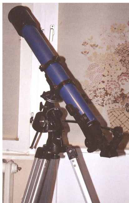
Im Test: Der Skywatcher 70/900 mm-Refraktor.

Das entspricht meiner persönlichen Erfahrung mit dieser Teleskopgattung. Als ich den Original-Lieferumfang meines 70 mm-Refraktors mit 900 mm Brennweite das erste Mal testete, war ich von den Bildfehlern (Restunschärfe bei bereits 36-facher Vergrößerung und starke Farbfehler) entsetzt. Ein Austausch gegen ein gutes Plössl-Okular vergleichbarer Brennweite lieferte dann eine Bildqualität, der sich manches hochwertige Markenteleskop nicht zu schämen bräuchte. Ein Problem der preiswerten Kleinteleskope wäre somit diagnostiziert: Der häufig grosse Satz an billigen Zubehörteilen lässt die wahre Qualität der Teleskop-Optik gar nicht erst ans Auge des Betrachters kom-