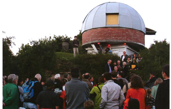
Grosser Besucherandrang auf der Sternwarte Rotgrueb in Rümlang anlässlich eines Themenabends. Das Interesse an der Astronomie in der breiten Öffentlichkeit ist gross. «Tage der Astronomie» sollen den Besuchern Einblicke in unsere Arbeit vermitteln.

■ Samstag, 24. April 2010, ganzer Tag SCHWEIZERISCHER TAG DER ASTRONOMIE der SAG (zusammen mit dem VdS) Zahlreiche Sternwarten und Planetarien in der ganzen Schweiz öffnen ihre Dächer und Kuppeln für die breite Öffentlichkeit. Über die die einzelnen Aktivitäten wird dann in der April-Ausgabe des ORION hingewiesen.