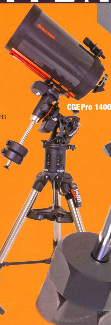
CGE Pro 1400