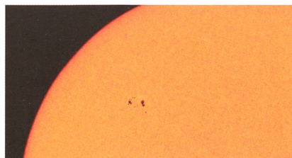
Kleines Intermezzo oder der Beginn des 24. Zyklus? Die SOHO-Aufnahme zeigt die Fleckengruppe am 2. Juni 2009.

Erwacht die Sonne nun doch aus ihrem Schlaf? Ende Mai, Anfang Juni 2009 (Bild unten) trat erstmals seit vielen Tagen und Wochen eine «grössere» Fleckengruppe auf. Ob nun der 24. Zyklus doch noch richtig in Gang kommt, werden die kommenden Wochen und Monate zeigen. Das ursprünglich auf die Jahre 2011/12 vorausgesagte Maximum dürfte nach den neuesten Prognosen erst 2015/16 auf tiefem Niveau zu erwarten sein. In der Grafik rechts ist zu sehen, dass die Vorhersagen im Oktober 2008 noch optimistischer waren.