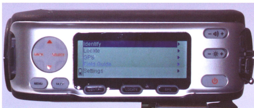
Dans cet article le Skyscout est monté sur une rotule et un trépied photo. Le SkyScout dispose d'un pas de vis "kodak" à cet effet.

Des composants électroniques sont apparus récemment pour mesurer les accélérations. Ces accéléromètres sont utilisés par exemple dans les airbags de voiture. La puce électronique dispose de quelques millièmes de seconde pour déterminer si la décélération brutale qu'elle mesure provient d'une collision, d'un freinage énergétique ou d'un passage