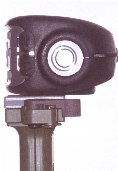
Le viseur du SkyScout avec ses deux cercles (mal) alignés. On voit également les couvercles pour la prise USB de connexion à l'ordinateur et la prise de l'écouteur. L'ordinateur n'est requis que pour effectuer une mise à jour éventuelle du SkyScout.

Les accéléromètres équipant le SkyScout ont une existence bien plus paisible. Depuis Isaac Newton on sait que la gravité exerce une force dirigée verticalement vers le centre de la Terre. Les composants sensibles à l'accélération de la gravité peuvent donner une information de l'orienta-