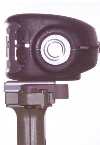
Le viseur du SkyScout avec ses deux cercles (mal) alignés. On voit également les couvercles pour la prise USB de connexion à l'ordinateur et la prise de l'écouteur. L'ordinateur n'est requis que pour effectuer une mise à jour éventuelle du SkyScout.

Les accéléromètres équipant le SkyScout ont une existence bien plus paisible. Depuis Isaac Newton on sait que la gravité exerce une force dirigée verticalement vers le centre de la Terre. Les composants sensibles à l'accélération de la gravité peuvent donner une information de l'orienta-