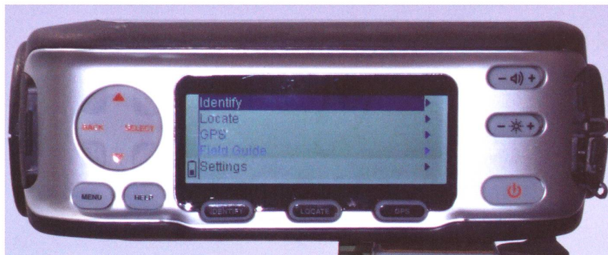
Dans cet article le Skyscout est monté sur une rotule et un trépied photo. Le SkyScout dispose d'un pas de vis "kodak" à cet effet.

Des composants électroniques sont apparus récemment pour mesurer les accélérations. Ces accéléromètres sont utilisés par exemple dans les airbags de voiture. La puce électronique dispose de quelques millièmes de seconde pour déterminer si la décélération brutale qu'elle mesure provient d'une collision, d'un freinage énergétique ou d'un passage