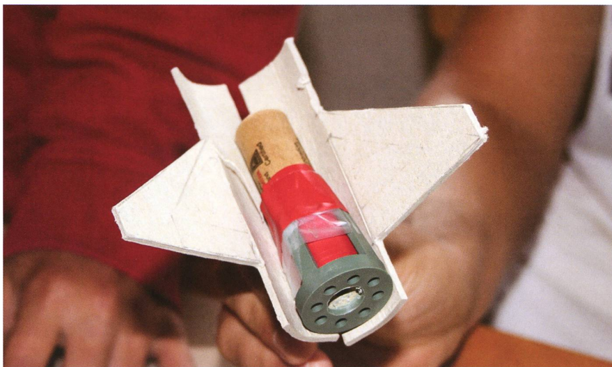
^ Ob der Raketenantrieb auch wirklich funktioniert?

Ist die Überalterung eines Vereins einmal eingetreten, wird die Nachwuchsförderung aufgrund der oben beschriebenen Punkte zu einer