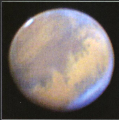
Noch ist er «Star» am Winterhimmel - Mars.

Die Oppositionsperiode von Mars ist am 30. Januar zu Ende gegangen. An diesem Tag wurde er stationär und beendete damit seine rückläufige Bewegung. Fortan wandert er wieder rechtläufig, das heisst von Westen nach Osten durch die hohen Bereiche der Ekliptik, entfernt sich mehr und mehr vom Stern Al Nath ( \beta Tauri) und steuert direkt auf \epsilon Geminorum zu, den er am Sonntagabend, 30. März in nur 15' nördlichem Abstand passiert. Bereits Ende der ersten Märzwoche zieht Mars ein letztes Mal am offenen Sternhaufen M 35 vorbei, dem er bereits im Oktober und Dezem-