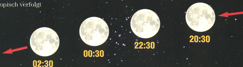
Die Bedeckung der Krippe durch den vollen Mond am späten Abend des 22. Januar 2008 wird man nur mittels Teleskop beobachten können. (Montage: Thomas Baer)