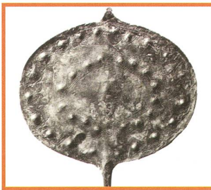
Der Venuskalender von Falera - 17