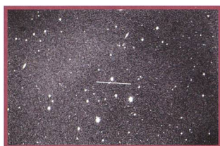
Das Schauspiel von 2007BD - 24