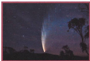
Les Potins d'Uranie Les Pompiers de Seattle - 29