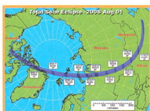
Wohin am 1. August 2008 - 8