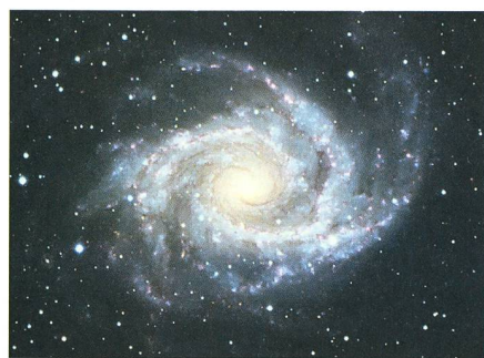
La galaxie spirale NGC2997 est également une radiogalaxie.

Comme déjà expliqué en ces pages 3 , les limites des constellations furent définitivement fixées en 1930 par E. Delporte pour le compte de l'Union Astronomique Internationale (UAI). Dans l'opération, les étoiles \beta et \gamma Ant (deuxième et troisième en brillance de la Machine Pneumatique ) passèrent définitivement dans les constellations voisines. L'étoile principale, \alpha Ant, est