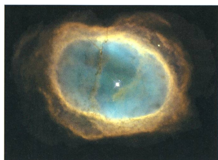
La nébuleuse planétaire NGC3132, située à la limite de la constellation des Voiles (Vela), ressemble à la célèbre nébuleuse M57 de la Lyre.

Revenons quelques instants à Lacaille pour indiquer qu'il participa à la vérification du méridien de Paris par des mesures entre Paris et Perpignan qui permirent de trancher en faveur des partisans de l'aplatissement de la Terre aux pôles. Son expédition au Cap fut soutenue par les Compagnies des Indes française et hollandaise. Son travail là-bas fut en quelque sorte le début de l'astronomie australe. Au-delà des posi-