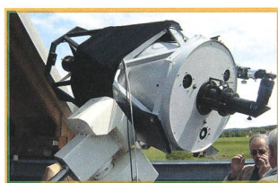
Generalversammlung der SAG Assemblée générale de la SAS - 16