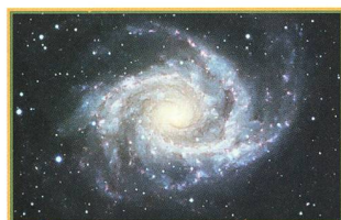
Les Potins d'Uranie: Le «truc d'Ernest» - 26