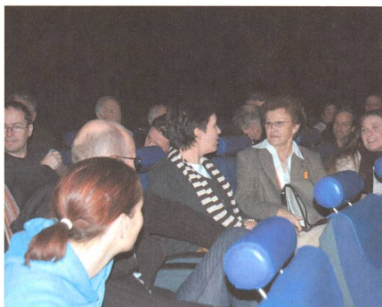
Gespanntes Warten auf den Beginn der Vorführung.

Zum Glück sah es dann am Samstag Nachmittag viel besser aus. Bereits gegen 16:00 Uhr waren schon mehr als 140 Ticketreservierungen abgeholt worden, und schliesslich war bei Beginn der Vorführung das Planetarium fast vollständig gefüllt.