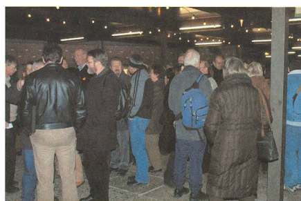
Grosses Gedränge vor dem Verkehrshaus.

Um 17:00 warten 205 gespannte Zuschauer aus der ganzen Schweiz in den bequemen Stühlen auf den Beginn der Vorstellung. Mit einer aus astronomischer Sicht völlig bedeutungslosen kleinen Verspätung von 10 Minuten beginnt um 17:10 Uhr die Vorführung.