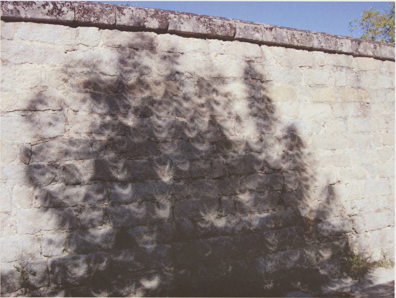
Ombres lors de l'éclipse de Soleil du 3 octobre 2005 à San Lorenzo de El Escorial.