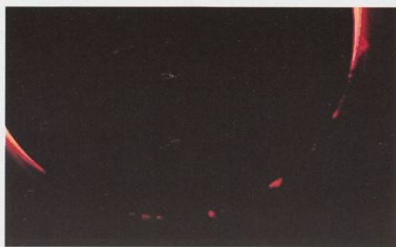
Nach dem 3. Kontakt schauen immer noch Protuberanzen hinter dem Mond hervor. Coronado SolarMax Telescope 40 mit Digitalkamera Coolpix 4500. A. BARMETTLER und R. BRODBECK.

mehr die Sonne hinter dem Mond verschwand. Auch die Tageserwärmung stoppte und kehrte sich in eine Abkühlung um. Diese Abkühlung wurde kurz vor der ringförmigen Phase so stark, dass wir an die Finger froren.