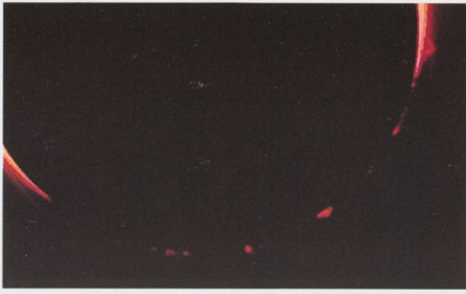
Nach dem 3. Kontakt schauen immer noch Protuberanzen hinter dem Mond hervor. Coronado SolarMax Telescope 40 mit Digitalkamera Coolpix 4500.

mehr die Sonne hinter dem Mond verschwand. Auch die Tageserwärmung stoppte und kehrte sich in eine Abkühlung um. Diese Abkühlung wurde kurz vor der ringförmigen Phase so stark, dass wir an die Finger froren.