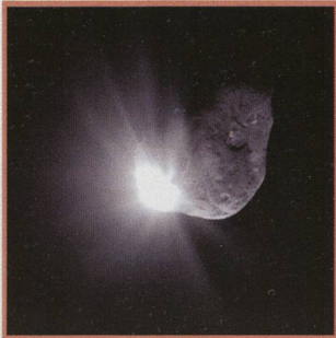
Schuss auf Komet Tempel I - 11