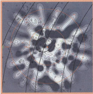
Aspects of Geneva Photometry - 4