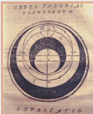
Astronomie und Mathematik in «bernischen Landen» im 16. und 17. Jahrhundert - 15