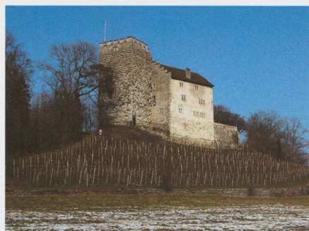
Fig. 3. Die Reste der etwas in Vergessenheit geratenen Stammburg des berühmten Fürstengeschlechts lassen ihre einstige Grösse und Bedeutung nur noch erahnen.

Und was meinen wohl die adeligen Habsburger zu dieser hübschen Geschichte? Das stolze Geschlecht hat schon sehr früh seine Stammburg verlassen und kam erst vom fernen Wien aus zu Macht, Ruhm und Ehre. Doch ganz ist der Faden zu den Ursprüngen nie gerissen: Etwa 30 Kilometer südöstlich der Burg liegt nämlich das bereits