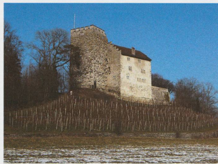
Fig. 3. Die Reste der etwas in Vergessenheit geratenen Stammburg des berühmten Fürstengeschlechts lassen ihre einstige Grösse und Bedeutung nur noch erahnen.

Und was meinen wohl die adeligen Habsburger zu dieser hübschen Geschichte? Das stolze Geschlecht hat schon sehr früh seine Stammburg verlassen und kam erst vom fernen Wien aus zu Macht, Ruhm und Ehre. Doch ganz ist der Faden zu den Ursprüngen nie gerissen: Etwa 30 Kilometer südöstlich der Burg liegt nämlich das bereits