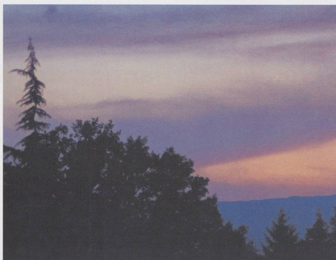
La conjonction de Vénus et Mercure du 27 juin 2005 à 20h 21m TU. Captée malgré les conditions de visibilité à Genève – moins bonnes qu'aux îles Canaries! Pose de 1/6 sec à pleine ouverture avec objectif de 85 mm f:1.4.