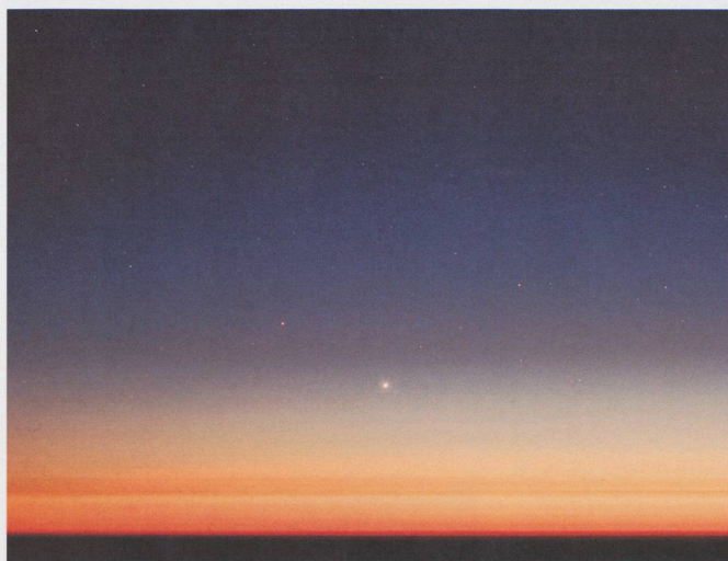
Saturne, Vénus, Mercure, les étoiles Castor et Pollux ainsi que l'amas de Praesepe (en haut à droite) apparaissent dans le crépuscule. Photo prise depuis l'Observatoire de Roque de los Muchachos, île de La Palma, Canaries, le 22 juin 2005 à 23h26m TU. Pose de 10 sec avec 50 mm à f:1.4 diaphragmé à 2.5.