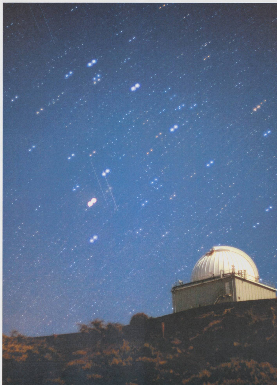
Superposition de deux photos consécutives montrant deux «satellites» qui se déplacent parallèlement! Deux poses de 20 sec initiées le 13 juin 2005 à 22h 21m 19s TU et 22h 22m 41s TU, respectivement (horloge de l'appareil photo: \pm 1 m!), île de La Palma, Canaries.

Qui a une suggestion concernant l'identification de ces objets?