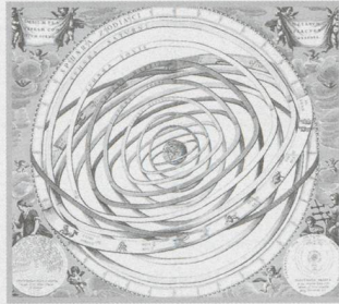
Le transit de Vénus et la quête de la parallaxe solaire - 22