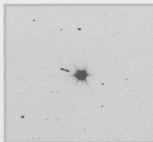
Eine Sekunde ohne Regulus - 41