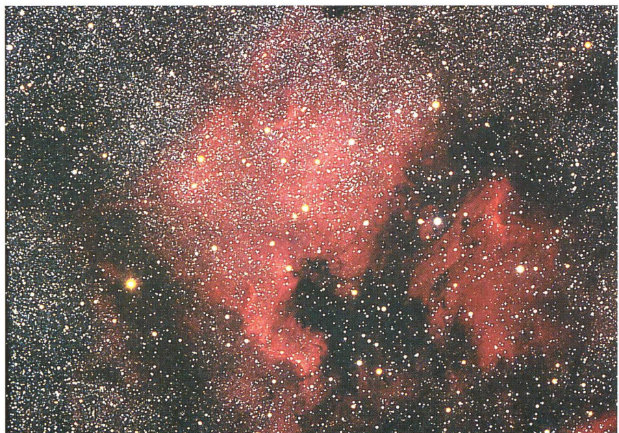
Aufnahme Rot H\alpha