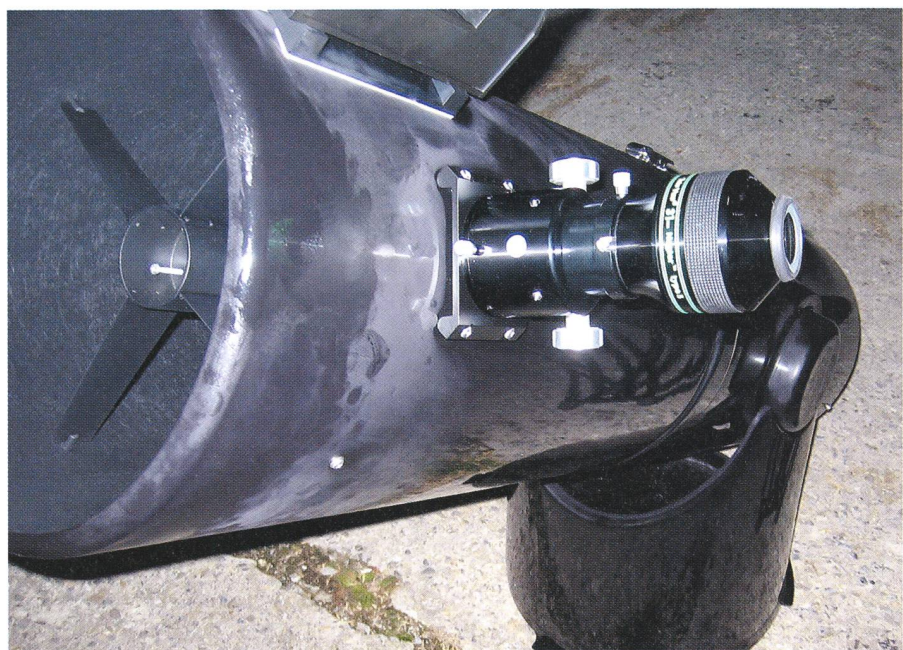
Das TV Nagler 31 mm am taubeschlagenen Ninja 32 cm Dobson.

Wenn man an lichtstarken Newton-Teleskopen Weitwinkelokulare einsetzt, machen sich am Rand des Gesichtsfeldes Bildfehler bemerkbar. Es handelt sich hauptsächlich um den Komafehler und in geringerem Ausmass um Astigmatismus und Bildfeldwölbung. Sterne am Bildrand erscheinen nicht mehr punktförmig, sondern aufgefächert wie ein Kometenschweif, der sich von der optischen Achse weggerichtet nach aussen öffnet. Dieser Effekt ist wohlgermerkt durch die Eigenschaften des Newton-Teleskops und nicht durch die Okulare bedingt. Einzig aufgrund dieses Problems auf den Einsatz solcher Weitwinkelokulare zu verzichten, würden wir jedoch als schade empfinden. Jeder Beobachter sollte deshalb für sich selber entscheiden, ob er mit den kleinen Kometen am Rand des