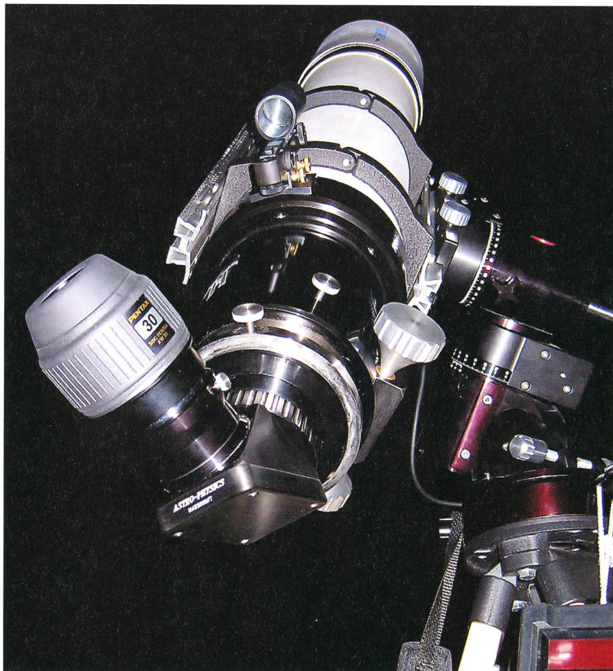
Das Pentax 30 mm XW am Astro Physics 155 mm EDF- Refraktor.