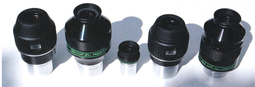
Die getesteten langbrennweitigen Pentax- und Tele Vue-Okulare: Pentax XW 30 mm, TV Nagler 31 mm, (TV Nagler Zoom 3-6 mm zum Grössenvergleich), Pentax XW 40 mm, TV Panoptic 41 mm (v.l.n.r.).

Ebenfalls in diesem Jahr hat Tele Vue zudem seine Panoptic-Okularserie (68° Eigengesichtsfeld) am langbrennweitigen Ende durch ein neues Zweizoll-Okular von 41 mm Brennweite ausgebaut. Was lag deshalb näher, als einen Vergleich der neuen Pentax XW-Okulare der Brennweiten 30 und 40 mm mit den TV-Okularen Nagler 31 mm und Panoptic 41 mm anzustellen? Getestet haben wir diese Okulare an zwei Refraktoren und zwei Newton-Teleskopen: Astro Physics 155 EDF (Öffnungsverhältnis 1:7.1), Pentax 75 SDHF (1:6.7), Ninja-Dobson 32 cm (1:4.5) und Eigenbau-Dobson 25 cm (1:4.8).