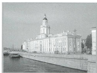
Leonhard Euler und die alte Sternwarte von St. Petersburg - 4