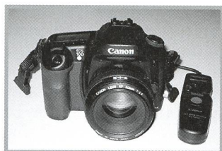
Die digitale Spiegelreflexkamera Canon EOS 10D - 28