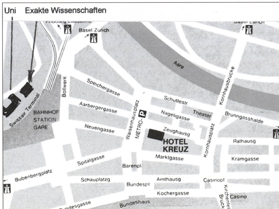
Situationsplan Obere Altstadt mit Bahnhof und Hotel Kreuz

Da die Platzverhältnisse in der neuen Sternwarte Zimmerwald limitiert sind, bedingt dies eine strikte Aufteilung der Besucher in Gruppen und die Einrichtung von Transporten zwischen den Besuchsstätten. Alle Gruppen besuchen beide Sternwarten. Eine Anmeldung zu den Besichtigungen ist unabdingbar, damit die Gruppeneinteilung vorbereitet werden kann.