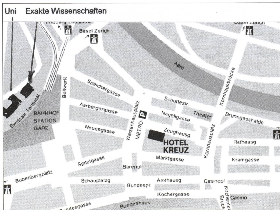
Situationsplan Obere Altstadt mit Bahnhof und Hotel Kreuz

Da die Platzverhältnisse in der neuen Sternwarte Zimmerwald limitiert sind, bedingt dies eine strikte Aufteilung der Besucher in Gruppen und die Einrichtung von Transporten zwischen den Besuchsstätten. Alle Gruppen besuchen beide Sternwarten. Eine Anmeldung zu den Besichtigungen ist unabdingbar, damit die Gruppeneinteilung vorbereitet werden kann.