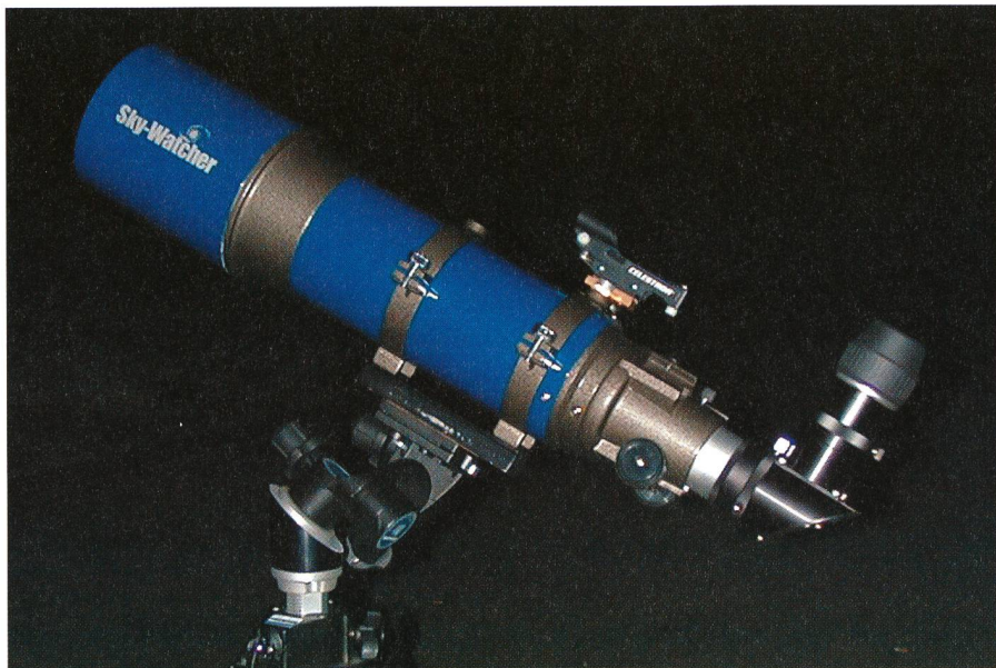
Fig. 2: Antares R120/600 auf Manfrotto Junior Getriebeneigekopf 410, Polhöhenkopf für 47° und Manfrotto Stativ Triman 028.

Die drei unterschiedlich grossen Refraktoren haben alle gute und sehr scharfe Optiken und zeigen bezüglich des Farbfehlers ein einheitliches Verhal-