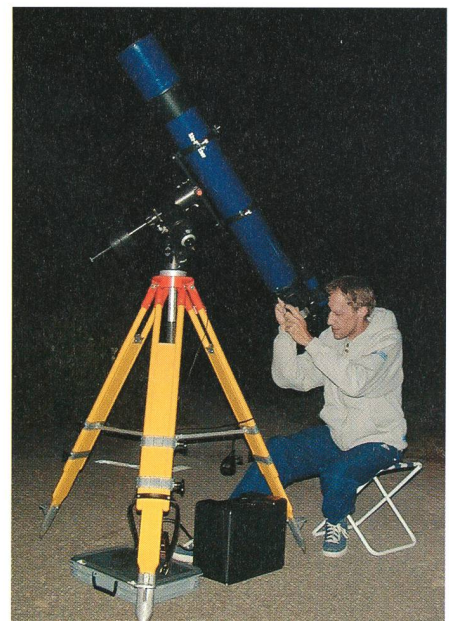
Fig.4: Antares R150/1200 auf GP-Montierung und G3-Harholzstativ.

Die mechanische Verarbeitung des Okularauszugs ist bei diesem Instrument recht gut. Im Gegensatz zu anderen Testberichten über dieses Teleskop [3], wo ein viel zu grosses Spiel bemängelt wurde, hat hier die Führung des Auszugs nur ganz wenig Spiel. Eigentliche Schwachstellen sind nur beim Zubehör festzustellen. Das mitgelieferte 1 1/4" Zenitprisma sollte auch bei diesem Instrument durch einen qualitativ guten 2 Zoll Zenitspiegel ersetzt werden. Langbrennweitige 2 Zoll Okulare bieten ein