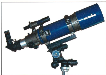
Fig. 1: Antares R102/500 auf Manfrotto Junior Getriebeneigekopf 410 und Stativ.

Wie bei kurzbrennweitigen Achromaten zu erwarten ist, sind die Ergebnisse bei Planeten nicht sehr berauschend, da hier der Farbfehler bei der benötigten hohen Vergrösserung stört. Die Abbildungsgüte des zweilinsigen Objektivs ist jedoch so gut, dass Doppelsterne von 1.5 Bogensekunden trotz der sichtbaren Farbsäume klar und deutlich getrennt werden.