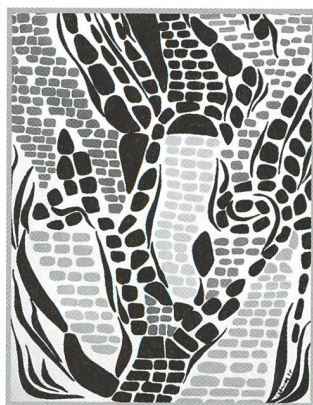
Les Potins d'Uranie Le Pavé de Saint-Jacques - 28