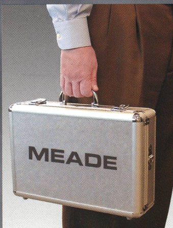
Die sieben Super-Plössl-Okulare dieses Angebots werden im praktischen Okularkoffer geliefert.

Meade Super-Plössl-Okulare der Serie 4000 entsprechen den hohen Anforderungen erfahrener Beobachter und vereinen exzellente Farbkorrektur mit hervorragender Abbildungsleistung über das gesamte 52°-Eigengesichtsfeld (44° beim f=40 mm Okular). Es handelt sich um Okulare aus der Standard-Produktion, die sich durch nichts von denen unterscheiden, die einzeln im Handel erhältlich sind. Die Okulare verfügen über umstülpbare Gummiaugenmuscheln, Multivergütung und Filtergewinde und sind jeweils in einer praktischen Schraubbox verpackt, die gleichzeitig als Staubschutz dient.