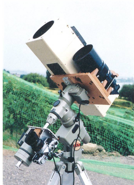
Fig. 1: La monture GP-DX.

Les clichés pris à l'aide de ma chambre de Houghton 130/150/496, qui est un instrument exigeant à l'instar d'une