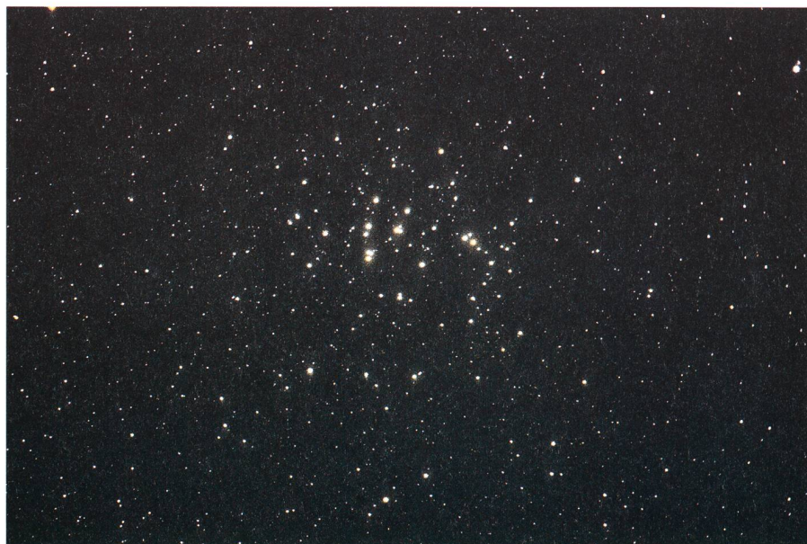
Fig. 4: L'amas ouvert M 44 du Cancer (Praesepe); Télescope Houghton 130/150/496, pose 6 min. sur film Kodak E100S; (2.03.02).