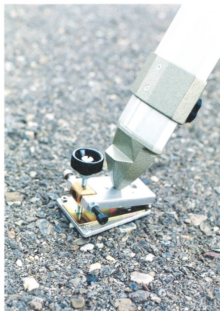
Fig. 2: L'équerre pour le réglage fin en altitude.

Ma première démarche fut de construire une bonne caisse: outre la monture, les deux contre-poids et la raquette de guidage, elle héberge toute la quincaillerie accessoire dans un espace solidement clos de 50 x 38 x 15 cm. Pour l'alimentation, une «Power-station» Einhell EGS 180 me fournit du courant continu de 12 V en quantité plus que suffi-