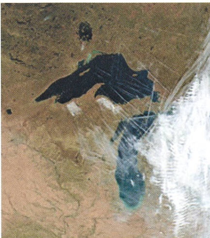
Une série de «contrails» persistantes flottent au-dessus de la région des Grands Lacs le 9 octobre 2000.

– B: Là, c'est le groupe de P. MINNIS, du NASA Langley Research Center, qui s'est penchée sur l'évolution de «contrails» au cours du temps. Ce fut plus particulièrement possible les jours d'interruption du trafic aérien commercial puisque les cieux étaient presque totalement dégagés et n'étaient fréquentés