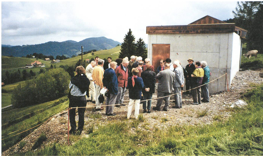
Erste Erklärungen vor der Sternwarte

Der harte Kern der SAG, ein paar Unentwegte, reiste wie üblich schon im Laufe des Freitags an. Jeder benutzte die Zeit für sich um Wattwil, den Gastgeberort, etwas näher kennen zu lernen. Für Einige war es nämlich das erste Mal, dass sie im Toggenburg waren. Am Abend traf sich dann die Vorhut im Restaurant zum Essen und natürlich für erste Gespräche.