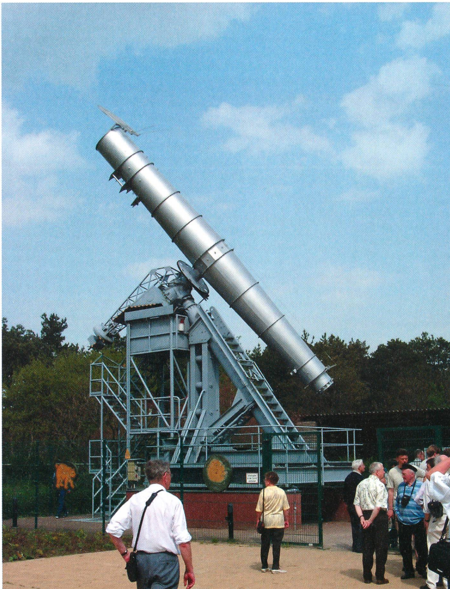
Fig. 1: Brachymedial-Fernrohr in Rathenow.