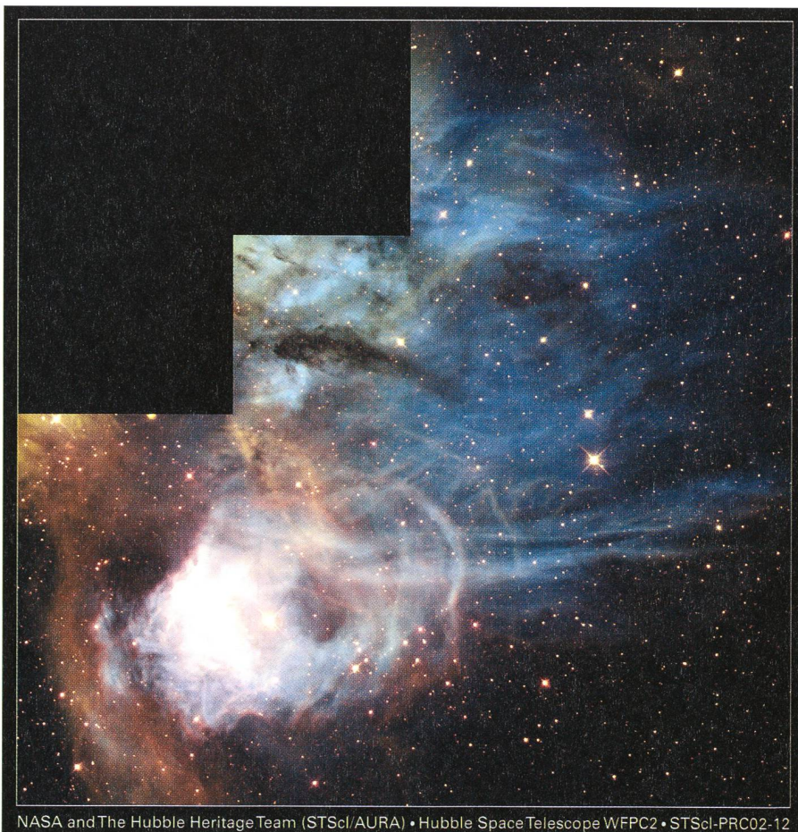
NASA and The Hubble Heritage Team (STScI/AURA) • Hubble Space Telescope WFPC2 • STScI-PRC02-12