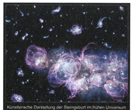
Fig. 1: Entstehung der ersten Sternengeneration aus Künstlersicht.

Die Dämmerung des Lichts, die sogenannte «Kosmische Renaissance», begann, als Wasserstoff in kleinen Gebieten zu kollabieren begann und den Punkt überschritt, an dem unter dem Einfluss der Gravitation die Kernfusion zündete und so die ersten Sterne bildete.