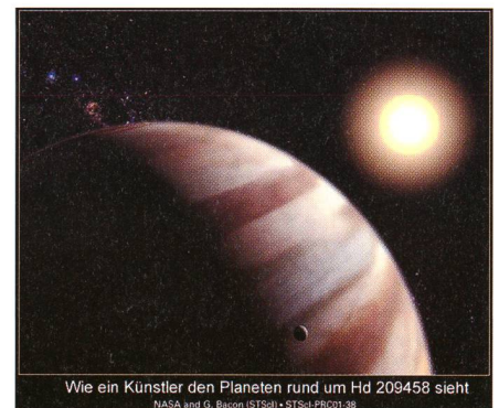
Fig. 1: Der Planet in der Sicht des Künstlers.

Bei dieser prekären Distanz zum Heimatstern wird die Atmosphäre des Planeten auf rund 1100 Grad Celsius aufgeheizt. Trotzdem ist der Planet gross genug, um seine kochende Atmosphäre festzuhalten.