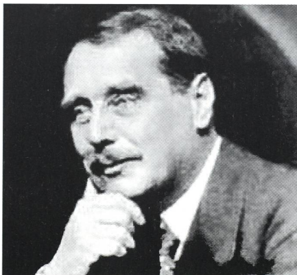
Fig. 2.: Herbert George Wells (1866-1946).

Quant à HERBERT G. WELLS (Fig. 2), il fut certes romancier, mais aussi journaliste, sociologue et historien populaire.