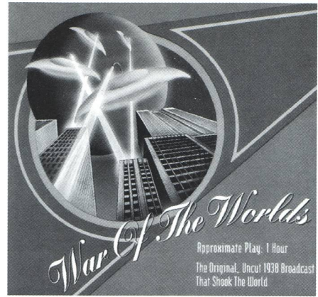
Fig. 3.: Le CD reprenant l'émission radio sur CBS du 30 octobre 1938.

Il fut l'un de ceux qui exercèrent une influence marquante au début du XX e siècle pour un changement de la société, des valeurs de référence et des croyances religieuses. Qui ne connaît pas ses plus fameux ouvrages, «La Machine à explorer le temps» (The Time Machine, 1895), «L'homme invisible» (The Invisible Man, 1897) et justement «La guerre des mondes» (The War of the Worlds, 1898) ou leurs adaptations cinématographiques? La version originale de «La guerre des mondes» a évidemment pour cadre l'Angleterre.