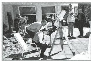
6. Internationale Astronomiewoche Arosa - 27