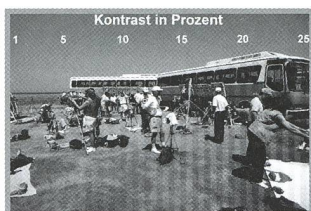
Schattenbänder fürs Fotoalbum - 11