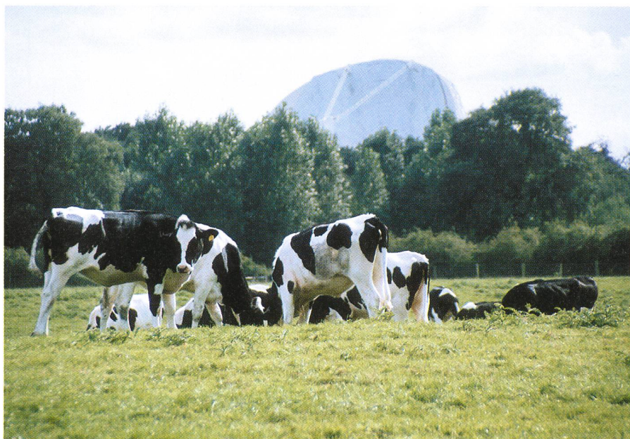
Le télescope Lovell Mark II s'élève dans les campagnes environnantes.

Il est intéressant de rappeler que le premier pulsar fut découvert non loin de Jodrell Bank, à Cambridge, par une équipe menée par ANTONY HEWISH en 1967. Il avait fait construire une petite antenne pour étudier le phénomène de scintillation interplanétaire, c-à-d les fluctuations en intensité d'une source radio distante dues aux effets perturbateurs de la couronne solaire. Son assistante, JOCELYN BELL, remarqua dans les enregistrements la présence d'une source scintillant de manière remarquablement régulière qui se répétait toutes les 24 h et transitait vers minuit, lorsque les perturbations de la couronne solaire étaient minimales. Après quelques mois d'observation, l'effet Doppler qui se révélait être en phase avec le mouvement orbital de la Terre confirma qu'il s'agissait d'une source lointaine et non d'un effet instrumental ou local. La découverte fut tenue secrète tandis que l'on nomma le phénomène LGM (Little Green Men) par perplexité ironique, tant la régularité de la pulsation semblait artificielle. Trois autres sources semblables furent découvertes et annoncées finalement en février 1968. La dissimulation de la découverte durant plusieurs mois