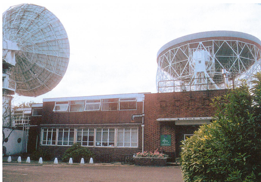
Bâtiment principal avec laboratoires et salle de contrôle du télescope Lovell de 76 m (à droite). À gauche, le télescope de 13 m consacré à la surveillance du pulsar du Crabe.

Pour parer aux problèmes de corrosion et de rigidité de la structure, une réparation totale fut entreprise à la fin des